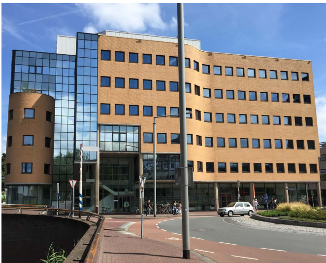
DOK 40, Dordrecht, Hollande