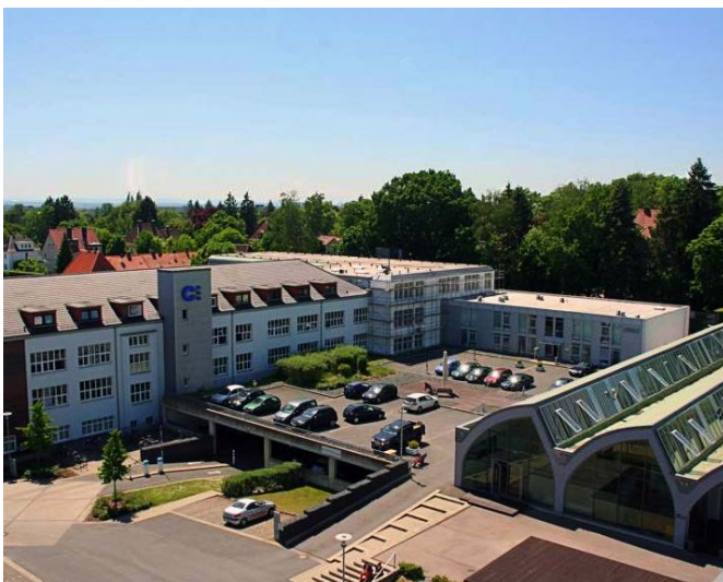
Campus 3, Braunschweig, Allemagne