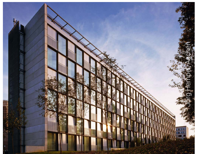
INNSIDE Hotel, Düsseldorf, Allemagne