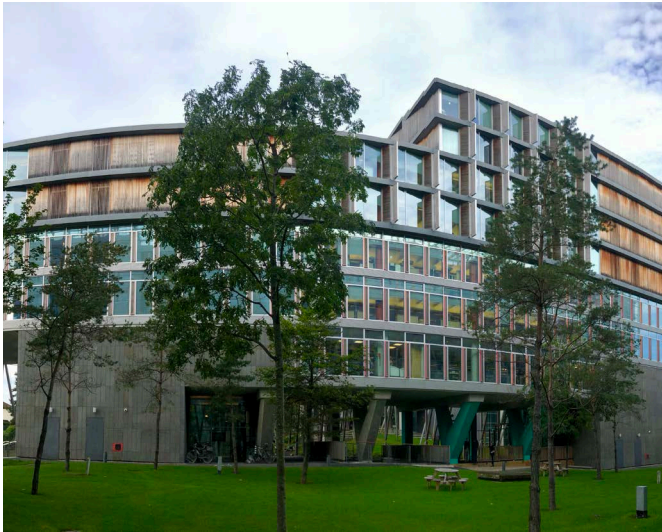
Elm Park, Dublin, Irlande