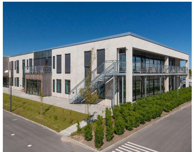
Kajakvej 2, Kastrup, Dänemark